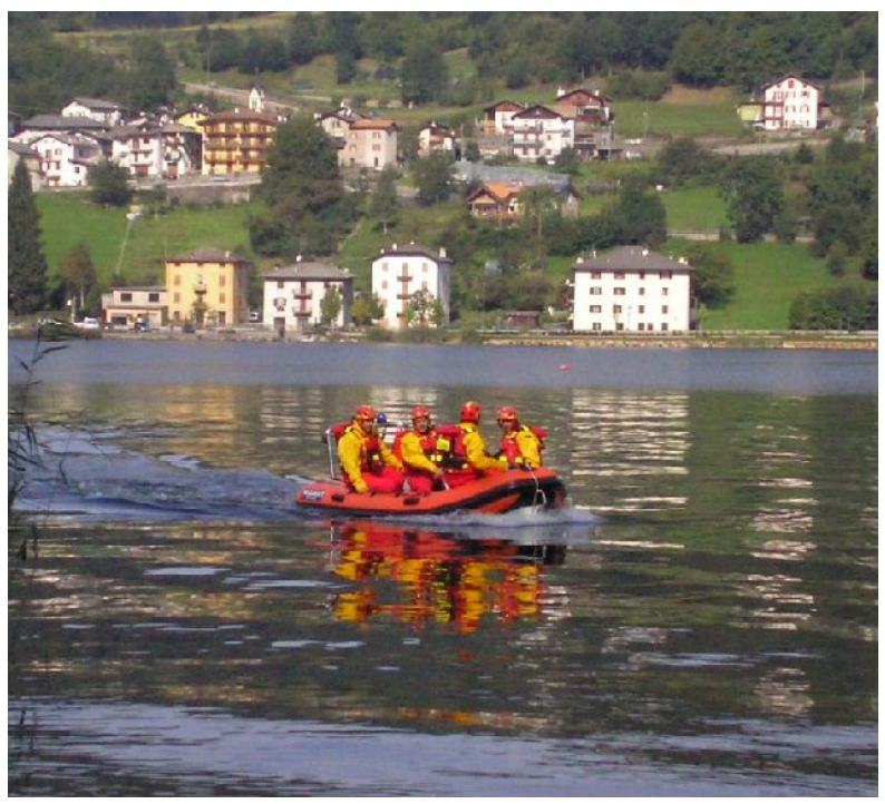
Fig. 2 – Gommone in navigazione e vigili del fuoco con idrocostumi

in neoprene e idrocostumi. Questi ultimi sono realizzati in materiale impermeabile, con collo e polsini in neoprene e piede in lattice. Consentono all'operatore di ripararsi dal bagnato e dal freddo garantendo una completa impermeabilità anche in acqua, non impedendo allo stesso tempo i movimenti, ma risultando estremamente versatili in molte condizioni d'uso in cui il vigile del fuoco è costretto ad entrare in acqua o comunque a bagnarsi. Il gommone è stato acquistato con il finanziamento al 70% della Cassa Provinciale Antincendi e per il restante 30% del Comune di Baselga di Pinè. Per chiunque fosse interessato, ulteriori informazioni, curiosità e notizie