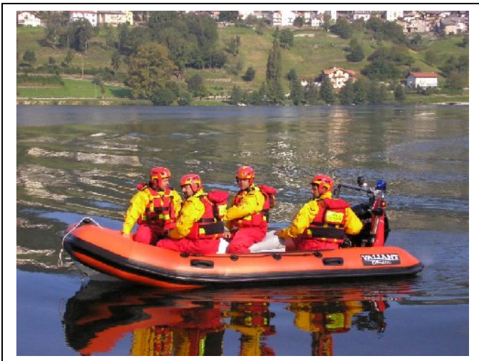
Fig. 1 – Nuovo gommone Valiant DR 400

Nel mese di settembre 2008, al già ricco equipaggiamento di mezzi ed attrezzature in dotazione al corpo dei vigili del fuoco volontari di Baselga di Pinè, si è aggiunto un nuovo gommone. Si tratta di